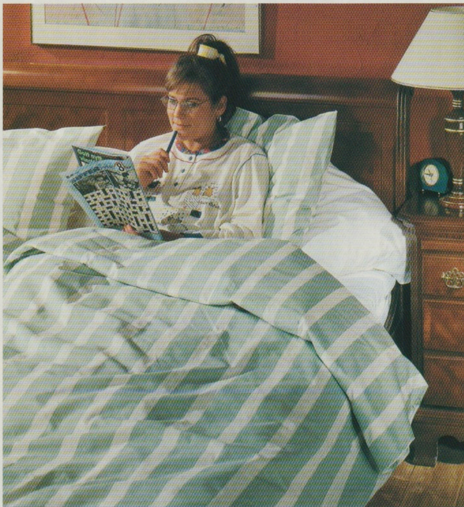
Almedahls hotellakan modell Ritz med mönster Athena – kanske något för din båt?

En sak var fullständigt klar redan från början: Att sova i sovsäck i vårt andra hem är uteslutet, sådant får tältare och kappseg-