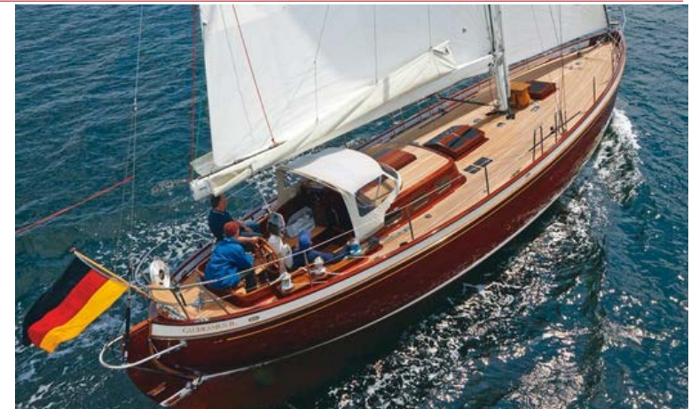
2014 Neuinterpretation des Doppelender Gaudeamus II

Persönliche Kundenbetreuung hat bei uns Priorität – von der Planung bis zur Jungfernfahrt und darüber hinaus. Oftmals bleiben die in Grauhöft gebauten Yachten für Jahrzehnte in der Obhut der Werft.