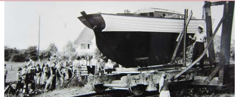
1959 Stapellauf Folkeboot „Kairos“ – heute im Familienbesitz