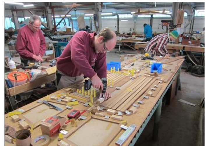
Sorgfältige Vorbereitung & Fertigstellung