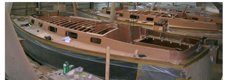
Scalar 34 im Bau – die GfK-Rümpfe werden komplett in Holz ausgebaut.