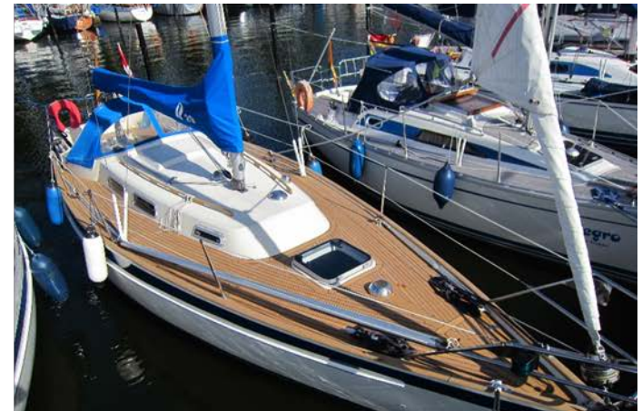
Stillechte Optik und Funktion

Übrigens: alle gebauten Scalar-Yachten (seit 1973) haben noch ihr erstes Teakdeck!