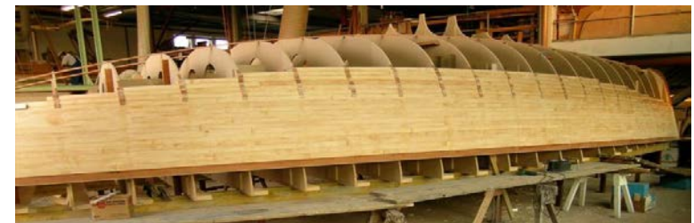
Ein Holzrumpf entsteht (Leistenbauweise)