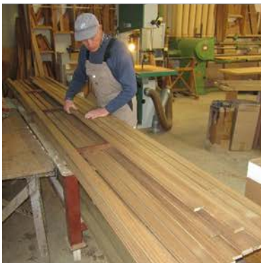
Ausgesuchte, lange Hölzer